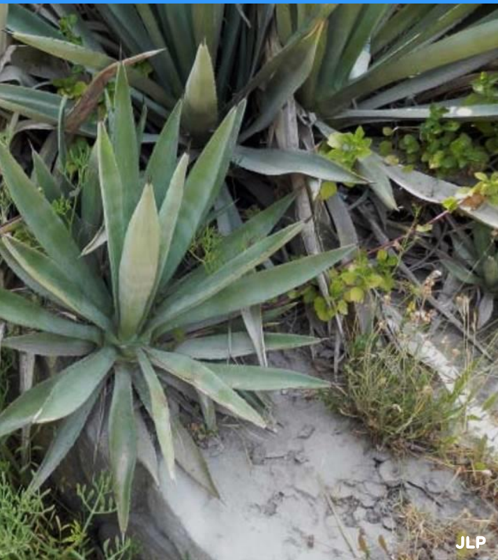
Agave fourcroydes ("sisal blanc") fulles molt rectes i apuntades