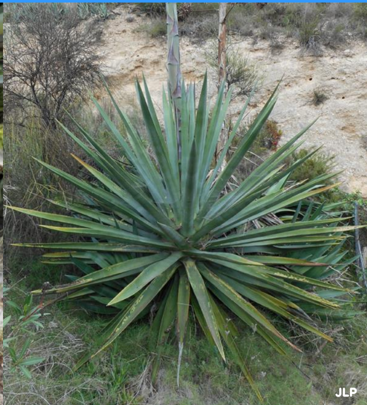
Agave sisalana ("sisal") fulles gairebé sense dents laterals